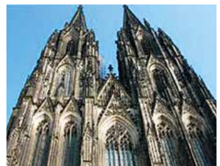
Genialitet satt i system. Tallet 153 hogd ut i stein. Kölnerdomen i Tyskland er kristenhetens viktigste signalbygg.