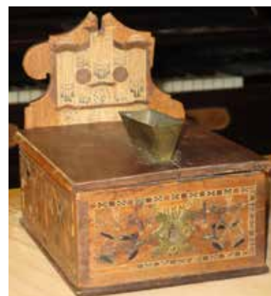
Kollektbøssa med håndverkens initialer og organistens navn.