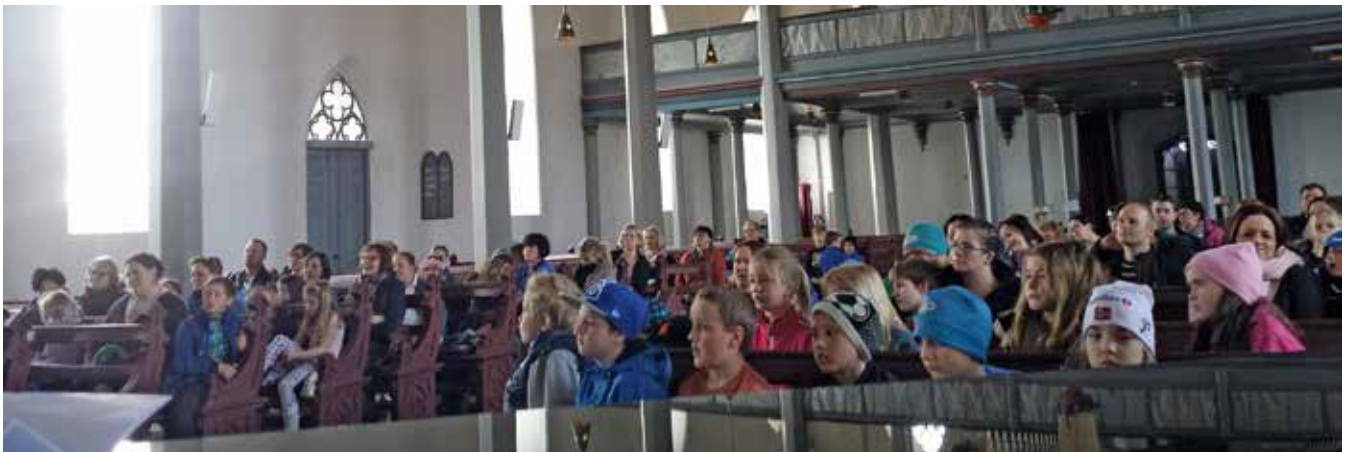
Tårnagentene avslutter dagens program med foreldre og søsken på besøk.