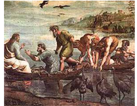
Miraklet med fiskefangsten. Bilde malt av kunstneren Raphael.

Den gotiske katedralen som har vært forbildet når våre trekirker skulle bygges, har en enorm klang. Kirkemusikken, spesielt Bachs orgelmusikk, er som skapt for dette rommet. Hva er lydbølger, tenkte kanskje vitenskapsmannen Rene Descartes inne i disse enorme gudshusene. Slike tanker var starten på den moderne vitenskap. Integralregning og komplisert matematikk ble etter hvert utviklet av slike geniale tenkere. Å tenke tiden som en rettlinjet akse er utvilsomt en kristen tanke – likeledes tanken om det enorme rommet som omgir oss i universet. Tidligere sivilisasjoner