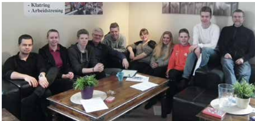
Ledere og fjorårskonfirmanter sørget for at årets konfirmantleir ble helt topp.