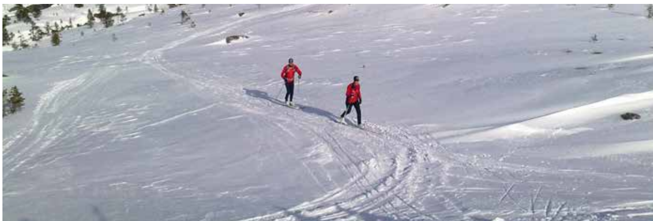
Vi har tre friluftsgudstjenester i Mosvik som er godt besøkt. Her på Røssheia der tradisjonen med skigudstjeneste er tatt opp igjen i samarbeid med Framverran idrettslag. Bildet er tatt fra Bjønnkammen under årets arrangement.