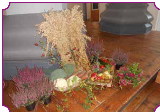
Pynta til høsttakkefest i Sakshaug kirke.