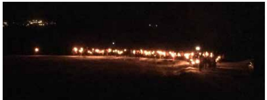
Elever med fakler i tog mot kirken.

Fakkelmessa er på mange måter starten på julen her i Mosvik. Siden arrangeres det mange