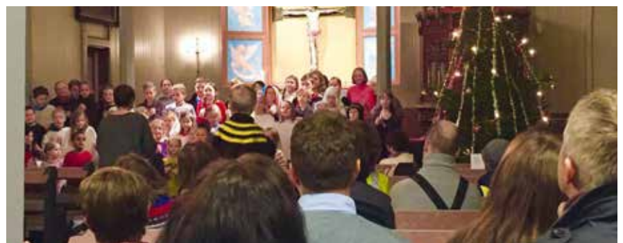
Barn og julesanger hører sammen.

juletreffester rundt om i mange forsamlingshus i bygda.