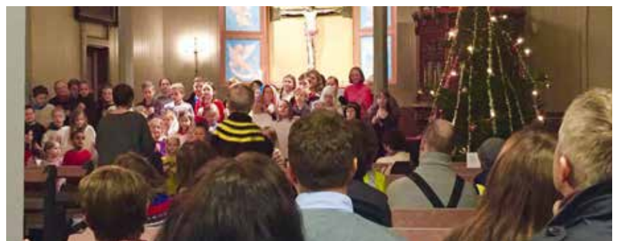
Barn og julesanger hører sammen.

juletreffester rundt om i mange forsamlingshus i bygda.