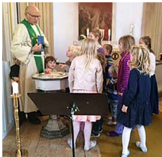
Tenk at her er også vi døpt!