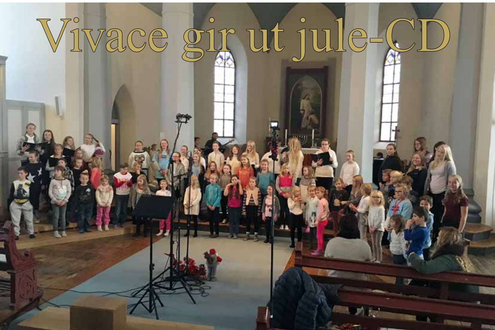
Innspilling av CD foregår.

Helga 11.–13. november spilte Vivace inn jule-CD. Det var en spennende og lærerik prosess.