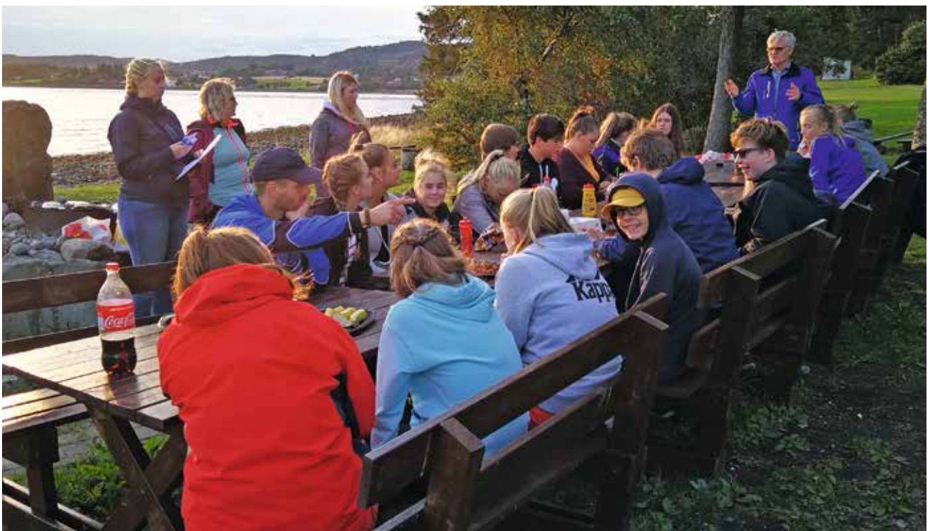
Gjensynstreff med årets konfirmanter på Sundsand 29. august. Det var lek, quiz og god mat i kveldssol.