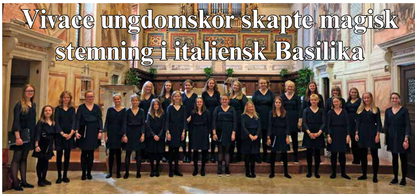
Vivace ungdomskor etter konserten i Santuario del Frassino.

Rett etter skoleslutt satte Vivace ungdomskor kursen mot Nord-Italia. Der holdt de konserter til stående applaus i kirker og på torg i byene Verona, Vicenza, Pescheria di Garda og Sirmione.