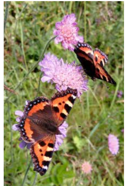
Sommer i Mosvik.

Fra Mosvik kan man se bort på et fjell i Verran som heter «Jorpetjahke». Mange steder i Mosvik har referanser til en sørsamisk bosetting i tidligere tider. Man kan godt si at Mosvik, iallfall før, lå i ytterkanten av et stort overlappingsområde