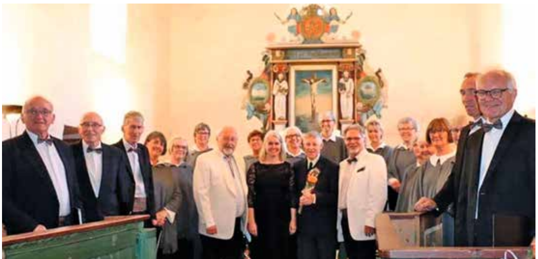
Alle aktørene fotografert i Hustad kyrkje.

PS. Personleg synest eg det var litt dumt at denne konserten gjekk føre seg samstundes som Inderøyfest, da eg meiner den hadde fortent både eit større publikum og omtale i avisa. Kanskje kan konserten – eller deler av den – gjentas? D.s.