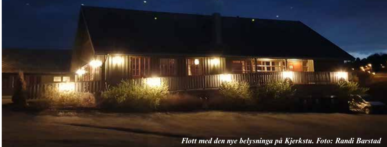
Flott med den nye belysninga på Kjerkstu.

Basaren til inntekt for Kjerkstu på Sakshaug gjennomføres på Kjerkstu fredag 12. oktober fra kl. 18.00 og lørdag 13. oktober fra kl. 11.00–15.00. Dette er den 30. basaren i rekka og dermed en lang og god tradisjon. Det blir populære, heimelaga varer å få kjøpe, ulike utlodninger og salg av kaffe og mat. Lørdag blir det også anledning til å få kjøpt rømmegrøt med tilbehør.