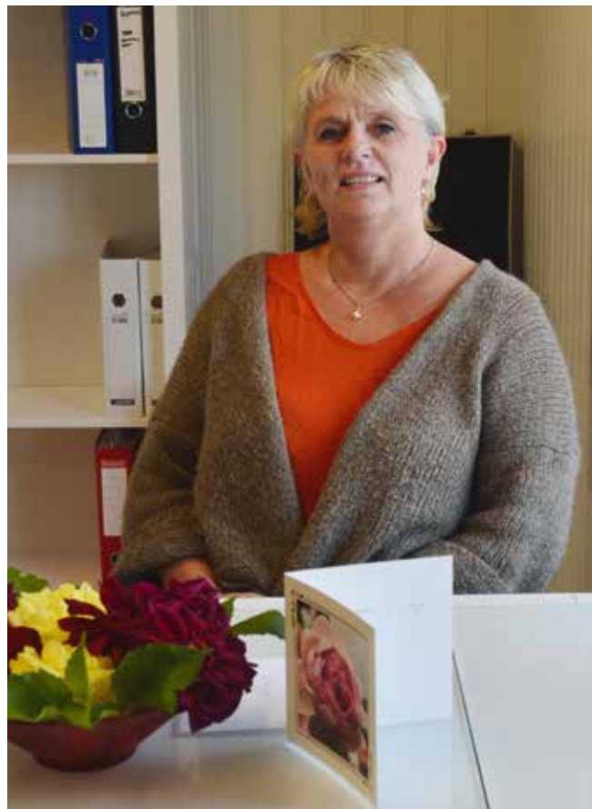
Marna på plass i kontoret sitt på Kjerkstu.