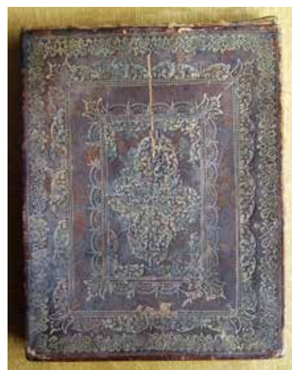
Den første norske læreboka i musikk fra 1744.