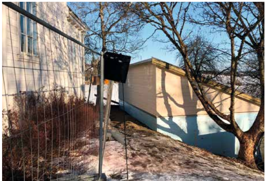
Servicebygget ligg på sorsida av kirka.