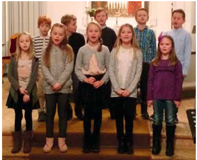
Friske og songglade tredjeklassingar!