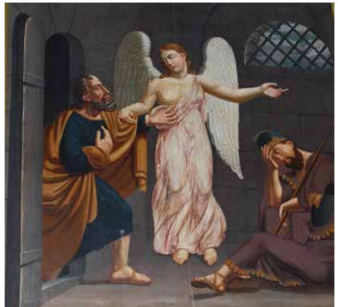
Maleriet i Mosvik kirke.

Bildet ser litt øde og kaldt ut, og vi ser ingen natur. I sentrum av bildet ser vi en engel som kun er drapert i et rosa slør. Mennene i bildet ser tafatte, trøtte og naive ut. Oppe på veggen er det et halvmåneformet vindu, som har et fiskegarnlignende gitter. Hendene og føttene i bildet, danner en sirkel – og diagonalene i bildet danner et punkt som brin-