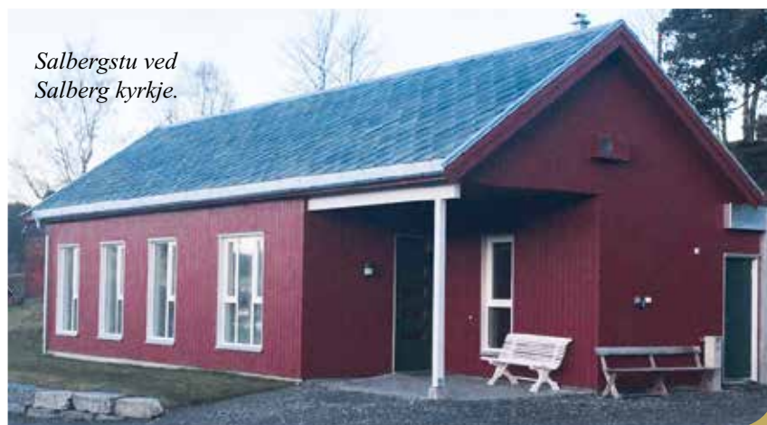
Salbergstu ved Salberg kyrkje.

Det er også behov for frivillige i Salbergstuas Venner!