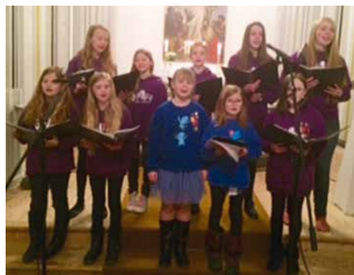
Jenter fra Vivace framførte "Aftenbønn for syngende barn".