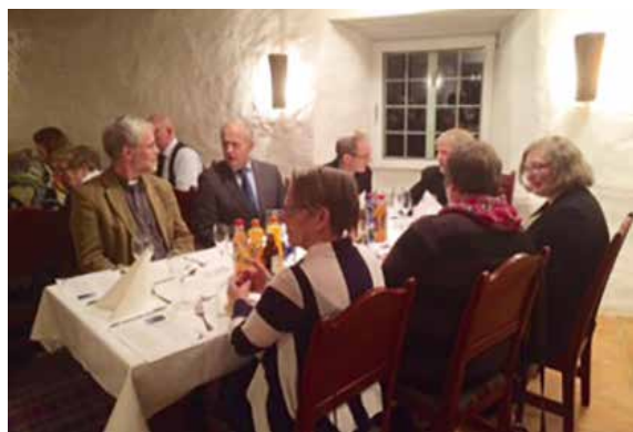
Frivillige og ansatte hygger seg i restauranten Hjorten på Gjørv.