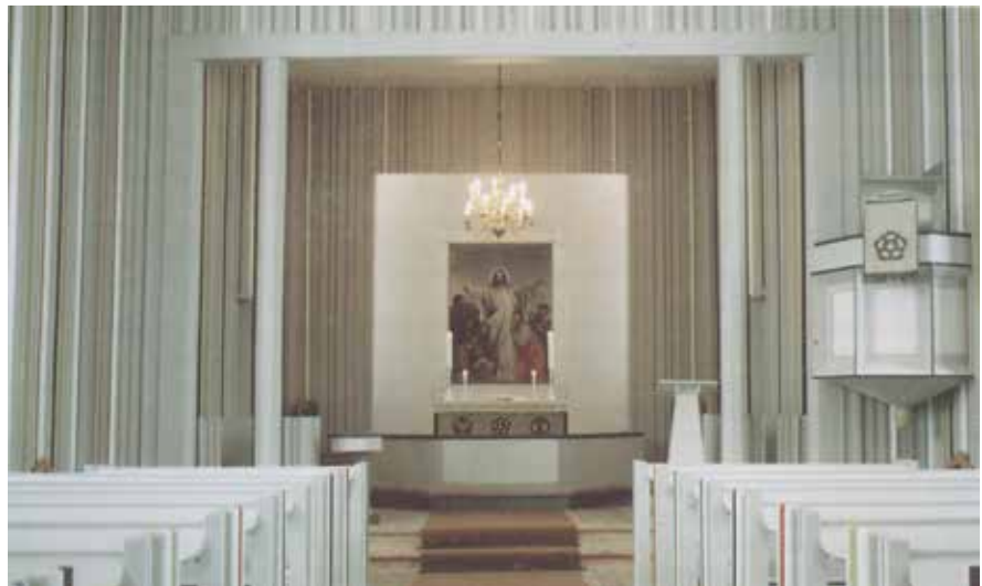
Frå Heggstad kyrkje.