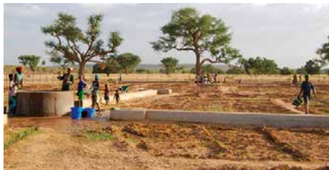
Nyanlagt grønnsakhage i Sare Hamadi. Vanningskanalene gjør det lettere for kvinnene å føre vann til åkrene.