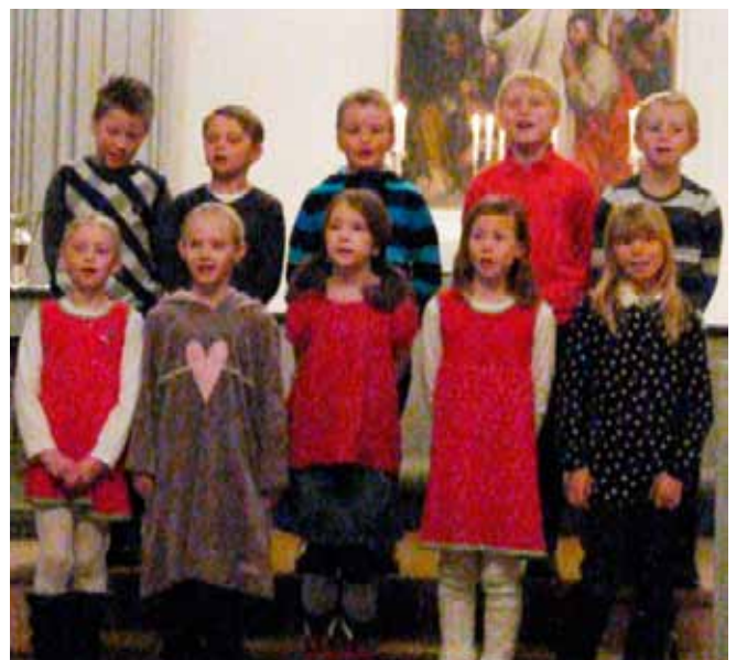
3. klasse ved Sandvollan skole sang fint og var gode representanter for skolen sin.