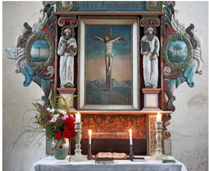
Altartavle Hustad kirke.

Har du behov for transport, ring tlf. 971 65 704 eller kirkekontoret, tlf. 74 15 60 20. Arr. Besøktjenesta.