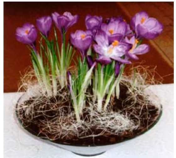
– Og tre uker senere stod krokusen i full blomst. Gud hadde gitt vekst.