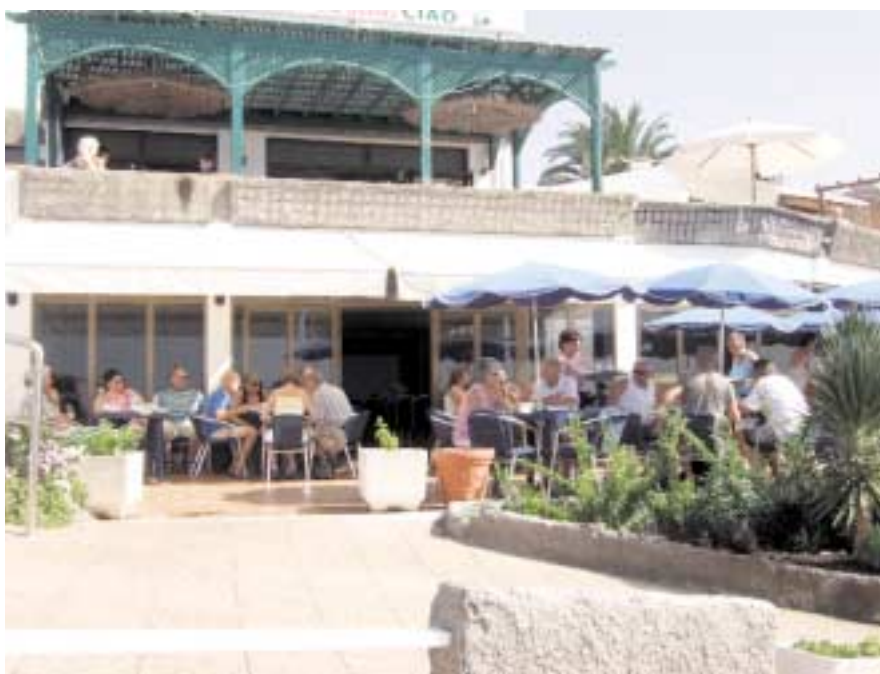
Her nytes det kaffe og vafler.