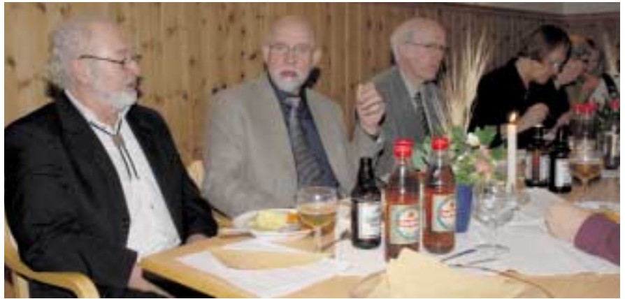
I gang Følsta