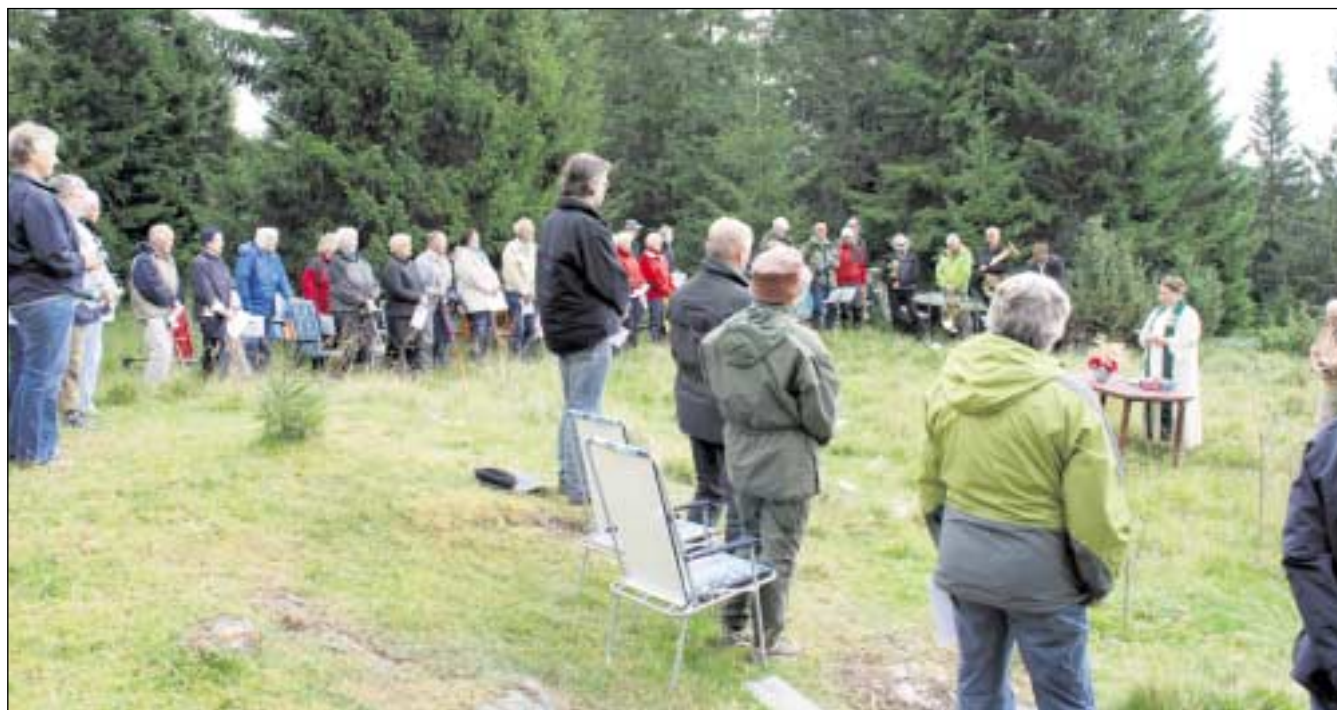
Friluftsgudstjeneste på Solem 2008.