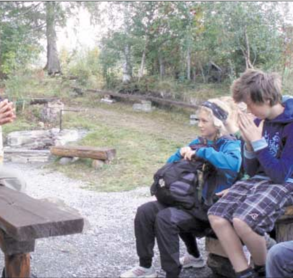
dselsveien ved Kvennstu.