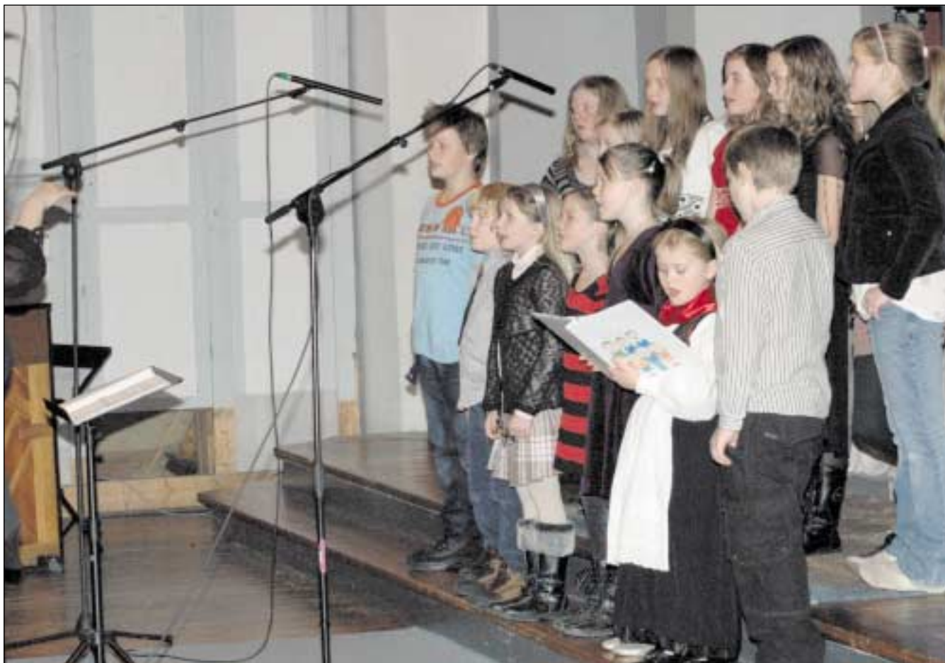
Barnekoret deltok under forestillinger i Sakshaug kirke i fjor.

Mange barn liker å synge, og ekstra morsomt blir det når man synger i lag med andre barn. Nå har barnekoret "Vivace" startet opp igjen.