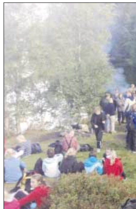
Matpause ve Leklemsvatnet.