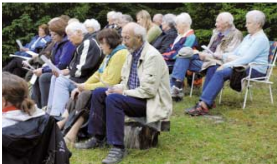
En engasjert menighet i salmesang.

Bygdas sokneråd og bondelag har i en årrekke i fellesskap arrangert denne bygdadagen med stort hell. Det er å håpe at Solemsdagene kan fortsette i mange år fremover, selv om det kanskje kan bli nødvendig å promotere konseptet noe bedre, spesielt mot de yngre generasjonene. Det er et faktum at gjennomsnittsalderen blant de besøkende er relativt høy, men dette kan det sannsynligvis gjøres noe med relativt enkle grep.