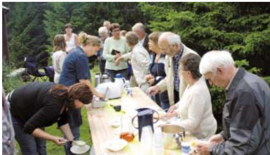
Besøkende på Solem, i matkø etter gudstjenesten.