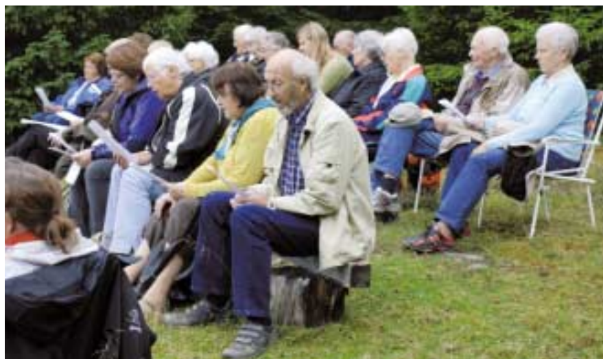
En engasjert menighet i salmesang.

Bygdas sokneråd og bondelag har i en årrekke i fellesskap arrangert denne bygdadagen med stort hell. Det er å håpe at Solemsdagene kan fortsette i mange år fremover, selv om det kanskje kan bli nødvendig å promotere konseptet noe bedre, spesielt mot de yngre generasjonene. Det er et faktum at gjennomsnittsalderen blant de besøkende er relativt høy, men dette kan det sannsynligvis gjøres noe med relativt enkle grep.