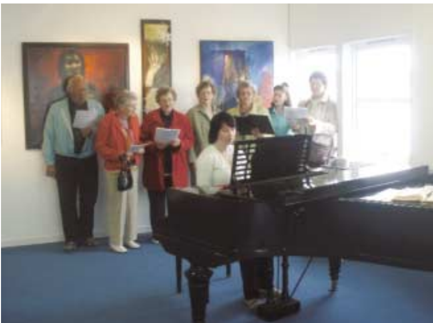
Det ble en minikorset på Galleri Tautra.

Det har fram til i dag vært tradisjon at han som fungerte som kirketjener i Loktug kirke, var fra gården som ligger ved siden av kirka.