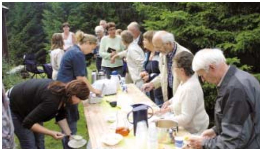
Besøkende på Solem, i matkø etter gudstjenesten.