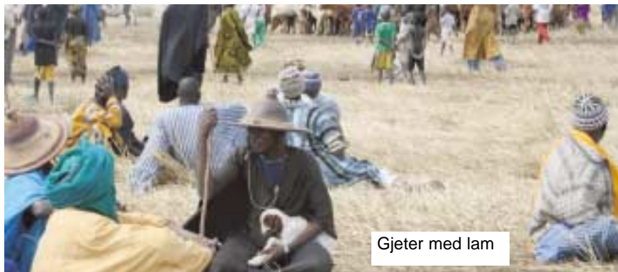
Gjeter med lam